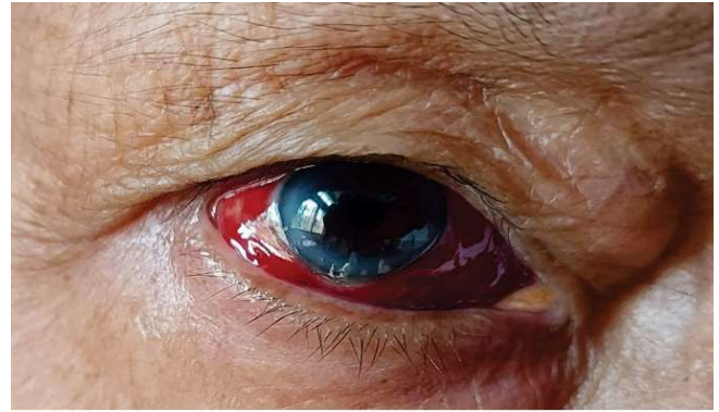
उपचारअघि आँखाको अवस्था (१ सेप्टेम्बर २०२१)

मैले हाम्रो मित्र होमियोपेथिक चिकित्सकलाई मेरो बुवाको दाहिने आँखाका फोटोहरू नियमित रूपमा देखाउँदै गएँ । बुवाको अवस्थामा सुधार हुँदै गयो । चिकित्सकले पहिलो पटक औषधी सेवन सुरु गरेको पाँचौँ दिनबाट अर्को एउटा औषधी (होमियोपेथिक) प्रयोग गर्न सल्लाह दिए, जुन सामान्यतया आँखामा रक्तश्रावको अवस्थामा प्रयोग गरिन्छ । सेप्टेम्बर १० को बिहान पुनः बुवाको आँखाको फोटो खिचेर पठाएँ, जुन फोटोले बुवाको आँखा स्पष्ट भएको देखायो । चिकित्सकको सल्लाह अनुसार तेस्रो औषधी थप पाँच दिनसम्म खुवाइयो । होमियोपेथी चिकित्सा पद्धति र हाम्रा चिकित्सकलाई धन्यवाद ! बुवाको आँखामा रहेको 'रातो हुने र दृष्टि धमिलो हुने' समस्या समाधान भयो ।